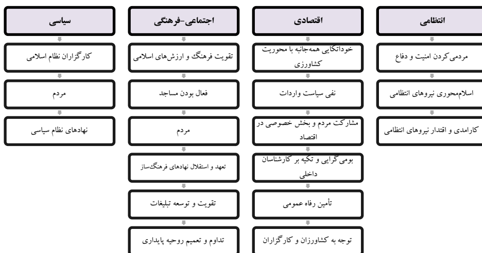
شکل شماره ۱. ابعاد امنیت داخلی از منظر امام خمینی (ره) (فرامرزی و ظرافتی، ۱۳۹۶)