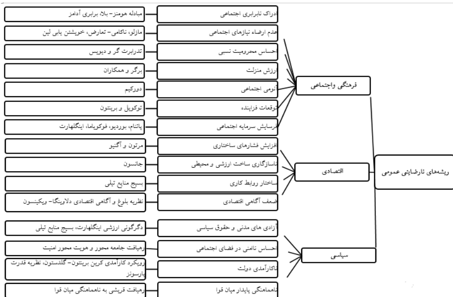
شکل شماره ۱. ریشه‌های شکل‌گیری رضایتهای عمومی (یافته‌های نگارندگان)