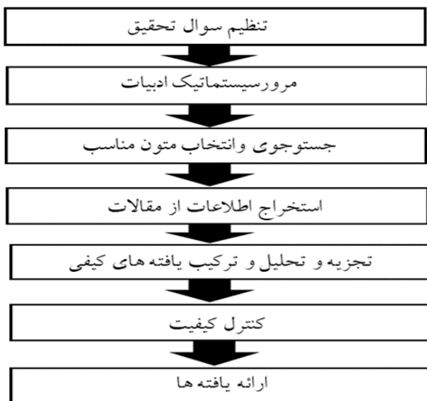
شکل شماره ۲. مراحل پیاده‌سازی فراترکیب (باروس و ساندلوسکی، ۲۰۰۶).

با بررسی و انجام موارد فوق، بسترها به‌منظور ارائه یک خط‌مشی در به‌کارگیری اینترنت اشیا فراهم می‌شود. در تحقیق حاضر به‌منظور تحقق هدف مطالعه، با بهره‌گیری از فرایند هفت مرحله‌ای «ساندلوسکی و باروس»، پژوهش‌های گذشته در حوزه سیاست‌ها، الزامات و یا خط‌مشی‌گذاری در فناوری‌های دیجیتال و یا اینترنت اشیا بررسی شده است. خلاصه این مراحل در شکل (۲) مشخص شده است. بر مبنای مراحل بیان‌شده در این شکل، پیاده‌سازی روش فراترکیب در بخش تحلیل یافته‌ها تشریح شده است.