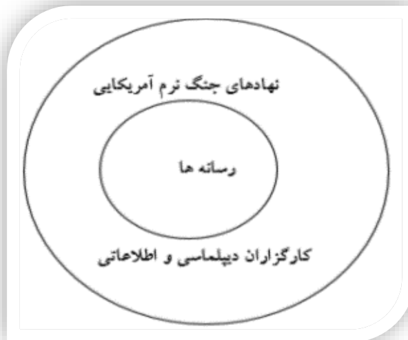
شکل شماره ۱. نگاشت مدل برجسته‌سازی در مذاکرات هسته‌ای

بر اساس دستورالعمل‌های مدل‌سازی بر یک مدل مفهومی مبتنی است، تحقیق حاضر بر یک مدل مفهومی بر اساس مفروضات و نظریات اولیه مبتنی است که در شکل (۱) نشان داده شده است. با توجه به پژوهش مورد نظر، در مذاکرات هسته‌ای طرفین مذاکره بارها در جنگ رسانه‌ای خود با برجسته‌سازی اقدامات و تحرکات، پیشبرد اهداف را فراهم می‌ساختند. بر اساس این نظریه، عوامل اجراکننده عملیات روانی برعهده دو گروه کلی رسانه‌ها و بخش دیپلماسی، اطلاعاتی و نهادهای جنگ نرم ایالات متحده بود که ساخت آگاهی عمومی و مرتبط با تحقق منافع آنها را در خصوص فعالیت‌های هسته‌ای ج.ا.ایران تأمین کرد. ادعایی که در ادامه با تحلیل محتوایی عملکرد کارگزاران جنگ نرم آمریکا با بهره‌گیری از راهکنش‌های عملیات روانی مورد ارزیابی قرار گرفته است.